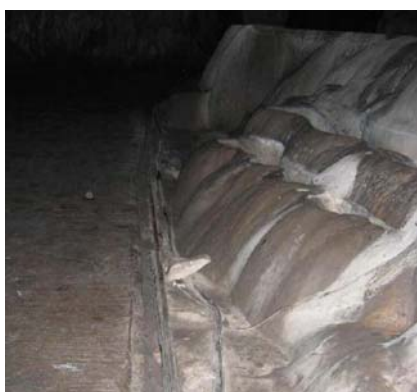
Cacahuamilpa: Abrasión de la roca para instalaciones

La basura afecta a este tipo de proyectos, que al tener gran afluencia turística en cualquier temporada del año, la cantidad de desechos, producto de lo consumible en tan sólo dos o tres días, puede causar deterioros. En Cacahuamilpa tomaron en cuenta un plan de manejo de residuos para el cuidado del medio ambiente y así evitar contaminación del lugar; la comunidad, actual administradora del sitio, planteó la recolecta, clasificación y reciclaje de los desperdicios para después venderlos y así comprar un camión recolector de basura y proseguir con el beneficio.