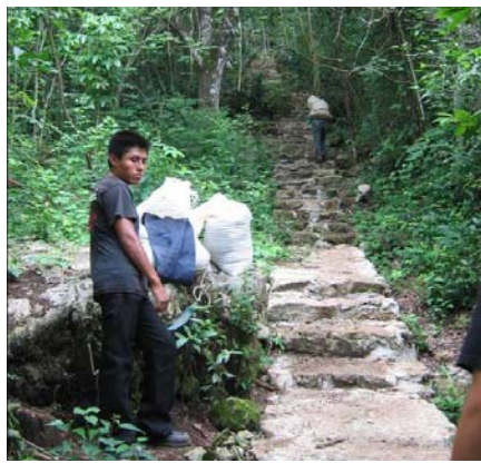
Senderos fabricados para llegar a la cueva del Espíritu