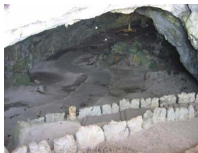
Acceso Principal a las Grutas de Cacahuamilpa”