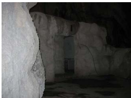
Cacahuamilpa: Sanitarios más cercanos al acceso

El abuso del uso del concreto sobre las superficies hace menos permeable la zona sobre la cual está aplicada la capa; el contacto del agua sobre la capa de concreto produce sales (salitre) que al estar junto a otras superficies las va degradando permitiendo así el desgaste continuo de las mismas y el deterioro de las formaciones naturales; a largo plazo las filtraciones que llega a haber a través del material tienen el mismo efecto sobre la capa natural de terreno; el aplanado de las superficies con medios abrasivos para aplicar estas capas de concreto también es de consideración.