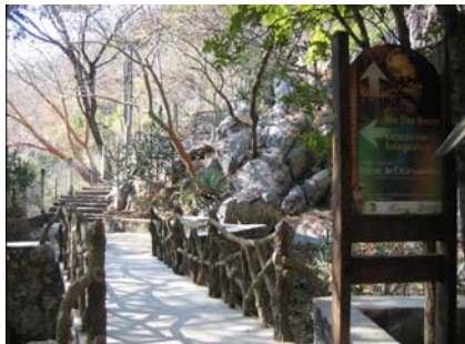
Cacahuamilpa: Fuera de las grutas en pasillos y corredores

El uso del concreto como material noble por el hecho de que el procedimiento constructivo es fácil, de bajo costo, de poco mantenimiento y de larga duración, se ha hecho presente en este sitio y en algunas partes se ha tratado de encontrar cierta armonía con el medio ambiente, muchas veces sin lograrlo. Sin embargo dentro de las grutas se ha usado de manera excesiva, llegando a ser notorio durante el recorrido, y aunque el refrán reza: “no fijándose ni se nota”, es cierto que la mayoría de las bellas formaciones llaman más la atención que los montículos de concreto que se tienen de frente. Un mal necesario o un bien innecesario?