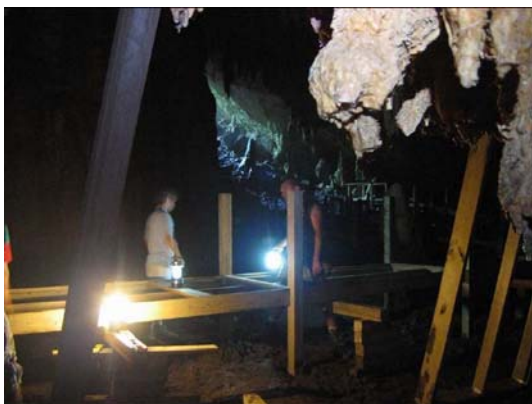
Trabajos realizados dentro de las cuevas

Las Grutas de Cacahuamilpa, como muchos lugares, bajo un buen manejo de los recursos, pareciera que no les hace falta nada, no obstante, se ha logrado mantener el interés de la comunidad en general para participar de manera directa y así obtener algún beneficio. Con la venta de los residuos de basura han logrado formar una cooperativa para brindar servicio de préstamos entre ellos y apoyar a su economía interna.