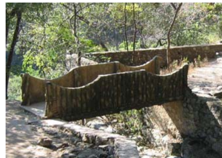
Cerca de las grutas camino a “Dos Bocas”