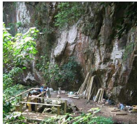
Mantezt'ulel Trabajos realizados fuera de las cuevas