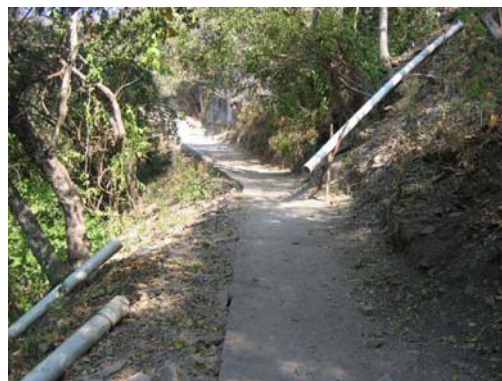
Instalaciones mal planeadas y en mal estado camino a “Dos Bocas”

Cacahuamilpa no sólo son las grutas, día a día el proyecto ofrece otras opciones que muchos conocemos, recorridos en ríos subterráneos, tirolesa, rapel, péndulo. La satisfacción de demandas al público visitante requiere de mayor personal que esté dedicado a estas actividades y al mismo tiempo de servicios para otorgarle a ambas partes. Muchas de las veces, como anteriormente se dijo, se da paso a la reparación de un problema de manera circunstancial y no programada. Lo podemos observar camino al paraje “Dos Bocas”, la falta de planeación ya rebasó la satisfacción de servicio sanitario y se han visto