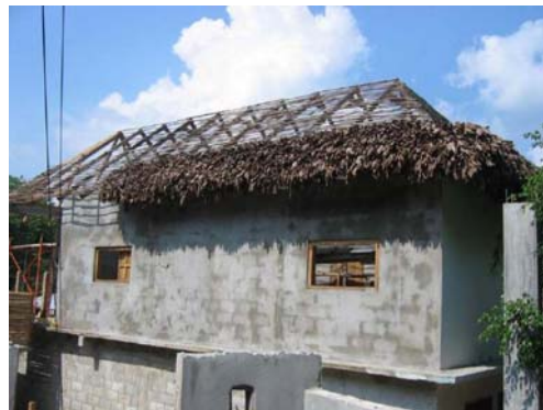
Expectativas y promesas falsas por falta de planeación. Proyecto para hospedaje a turistas cancelado por el uso inadecuado de materiales