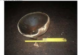
CAZUELA CON EVIDENCIA DE QUEMADO.