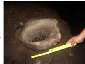
FONDO DE UNA OLLA PETRIFICADA, ASENTADA SOBRE EL SUELO DE LA CUEVA