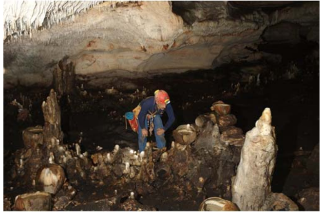
Imagen de Mario Novelo