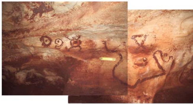
Cámara con la mayor cantidad de Vasijas. Pintura rupestre al fondo.