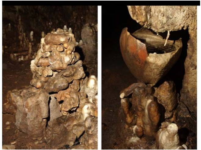
Imagenes de Mario Novelo