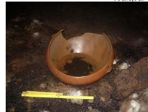
CAZUELA CON AGARRADERAS.