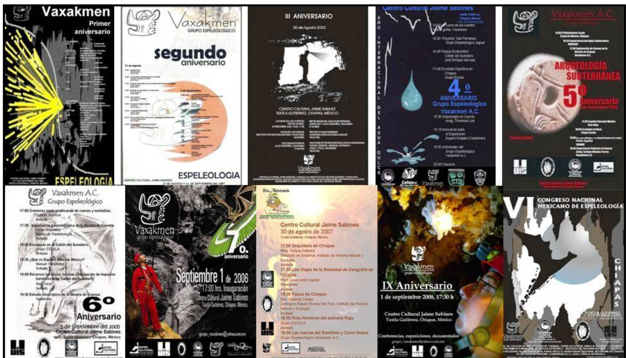
Figura 2. Carteles de los 9 eventos de aniversario y el VI Congreso Nacional Mexicano de Espeleología

Ahora, a nueve años de divulgar, y haciendo referencia al conocimiento científico, comprendemos que “...la divulgación de la ciencia es capaz de crear entusiasmo por y en el proceso de aprendizaje; concientizar y sensibilizar sobre la importancia de la ciencia y la tecnología como detonantes para el desarrollo; elevar la autoestima de quienes aprenden fuera del aula e incluso producir placer, el placer que tiene que ver con el entender y crear” (Sabugal, 2003; 19). Definitivamente que en Tuxtla Gutiérrez, se está generando interés por parte de la sociedad hacia el conocimiento de las cuevas. El agua, las formas de vida, los minerales, las leyendas, los vestigios arqueológicos, los rituales, son elementos que bien conducidos y presentados, evidencian el beneficio de esta disciplina.